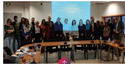
Les agences d'urbanisme de PACA et Action Logement Services se sont réunis le 13 janvier.

Dans la commune des Alpes-Maritimes, la résidence « Biotifull » est voisine de la Technopole de Sophia-Antipolis. C'est un programme mixte pour répondre à des besoins variés, composé de locatif social et intermédiaire et d'accession libre et encadrée. Parmi les 54 logements sociaux, 18 seront proposés exclusivement en colocation par le bailleur Habitat O6. Financier, Action Logement est réservataire de 20 logements, dont une partie est éligible à la colocation. Une offre qui permettra aux salariés d'accéder à un logement spacieux, à proximité de leur lieu de travail, pour un loyer très accessible. La livraison est prévue pour la fin de l'été.