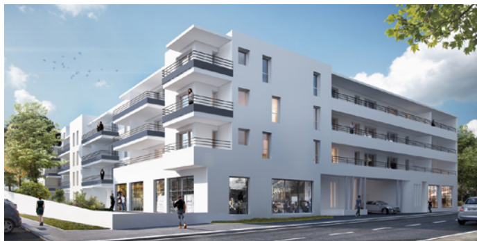
La Cité Jardins « Domaine d'Hestia » à Béziers

Inaugurée en février dernier, cette première résidence sociale dédiée aux séniors dans le département propose 92 logements sociaux tout confort, agrémentés de terrasses et d'espaces verdoyants.