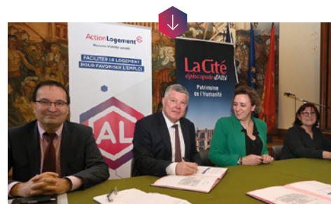
Signature de la convention « Action Cœur de Ville » à Albi.

Cette convention de partenariat « Action cœur de ville » a été signée le 11 février 2020 entre Action Logement, la ville d'Albi et la communauté d'Agglomération de l'Albigeois. Elle s'inscrit en faveur de la transition énergétique, en encourageant les rénovations performantes.