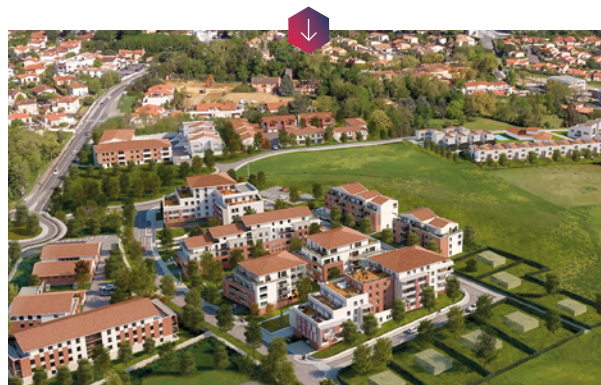
ZAC de Tucard « L'orée du Bois » - Saint-Orens de Gameville (31)

Ainsi à Saint-Orens-de-Gameville , au sud-est de Toulouse, Promologis illustre ce savoir-faire à travers le co-aménagement avec OPPIDEA (SEM de Toulouse Métropole) d'un site de 4 hectares. En 2022, plus de 200 logements seront réalisés par Promologis, CA Immobilier et Promomidi: 57 logements locatifs sociaux, 35 logements en accession sécurisée à la propriété et