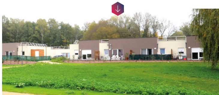
Le « VillaGénération » à Audincourt, nouveau concept d'habitat spécifique pour les seniors.

Au cœur d'un nouvel écoquartier, le concept « VillaGénération » de Néolia s'adresse aux seniors autonomes. Il leur permet de bien vivre à domicile en restant autonomes, tout en partageant des moments de vie en commun. Les 20 logements de plain-pied bénéficient des adaptations et équipements nécessaires à la sécurisation et à la facilité d'usage des logements (salle de bain adaptée, volets roulants motorisés...). Au cœur du projet, une maison commune abrite notamment le bureau d'une salariée du CCAS d'Audincourt. Interlocutrice privilégiée des résidents du « VillaGénération », sa mission est de développer le lien social, d'accompagner les résidents et d'animer la structure. Une offre de services des plus complètes pour les locataires.