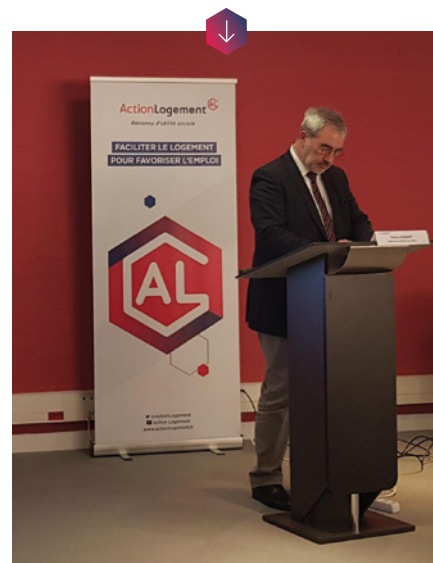
Présentation de l'ONV par Action Logement, à Dijon.

Dans le cadre d'une politique de construction volontariste, Action Logement a créé en février 2019 l'Opérateur National de Vente (ONV). Mis à disposition de tous les organismes de logement social, cet outil est chargé d'accompagner la vente de logements Hlm dans les meilleures conditions. Il favorise l'accession à la propriété des ménages modestes tout en générant, pour les collectivités, de nouvelles marges de manœuvre pour la restructuration du patrimoine social.