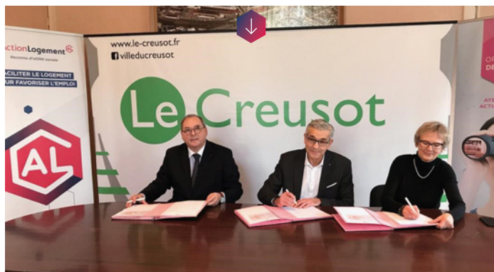
Signature de la convention immobilière entre la ville du Creusot (71) et Action Logement, le 18 décembre 2019.