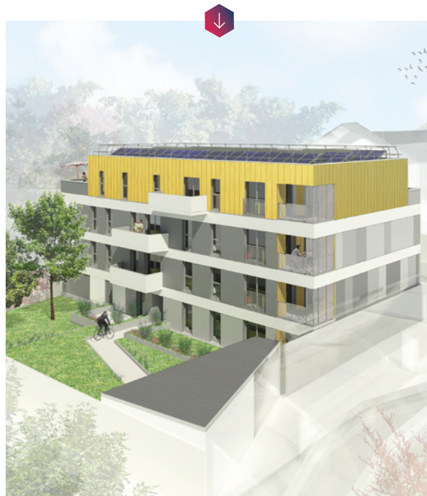
La future résidence « Clément Janin » à Dijon, dont la construction devrait s'achever fin 2020.