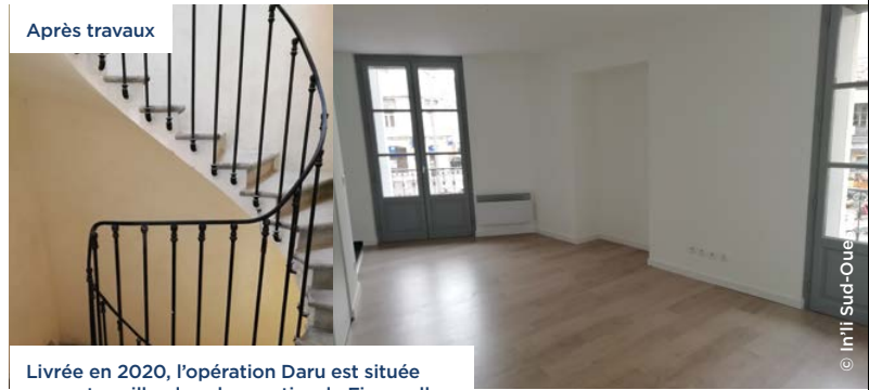
Livrée en 2020, l'opération Daru est située en centre-ville, dans le quartier de Figuerolles.