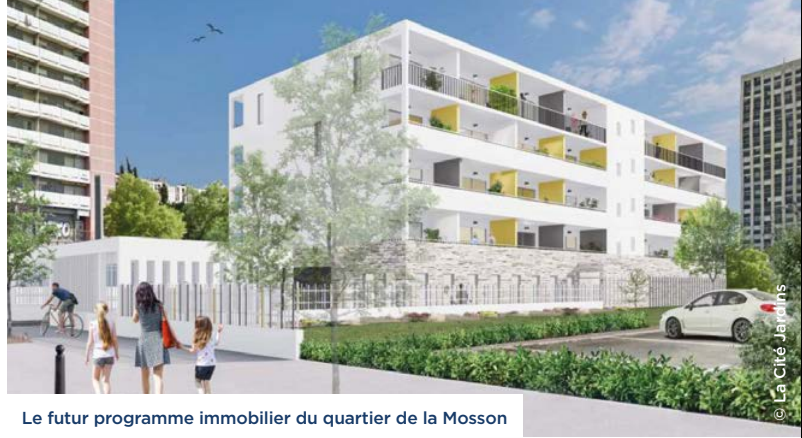
Le futur programme immobilier du quartier de la Mosson

Que faire d'un bâtiment laissé à l'abandon dans une ville hautement touristique ? À proximité du centre-ville d'Agde, un ancien hôpital va bientôt héberger des saisonniers. Le projet de réhabilitation de ce bâtiment classé est porté par La Cité Jardins et cofinancé par Action Logement dans le cadre du dispositif Action Coeur de Ville. Il prévoit la réalisation d'une résidence comprenant 43 logements et des espaces communs.