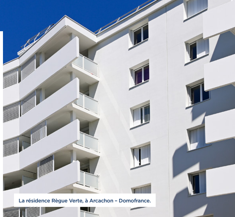
La résidence Règue Verte, à Arcachon - Domofrance.

Au premier semestre 2021, Clairsienne a livré 452 logements dont 35 en accession sociale. Notamment dans le département de la Gironde, avec la résidence le Forum, 22 nouveaux logements sociaux avec parking et terrasse au cœur de la ZAC du centre-ville de Mérignac ; la résidence Du Coteau, 16 maisons et 17 appartements à Saint-