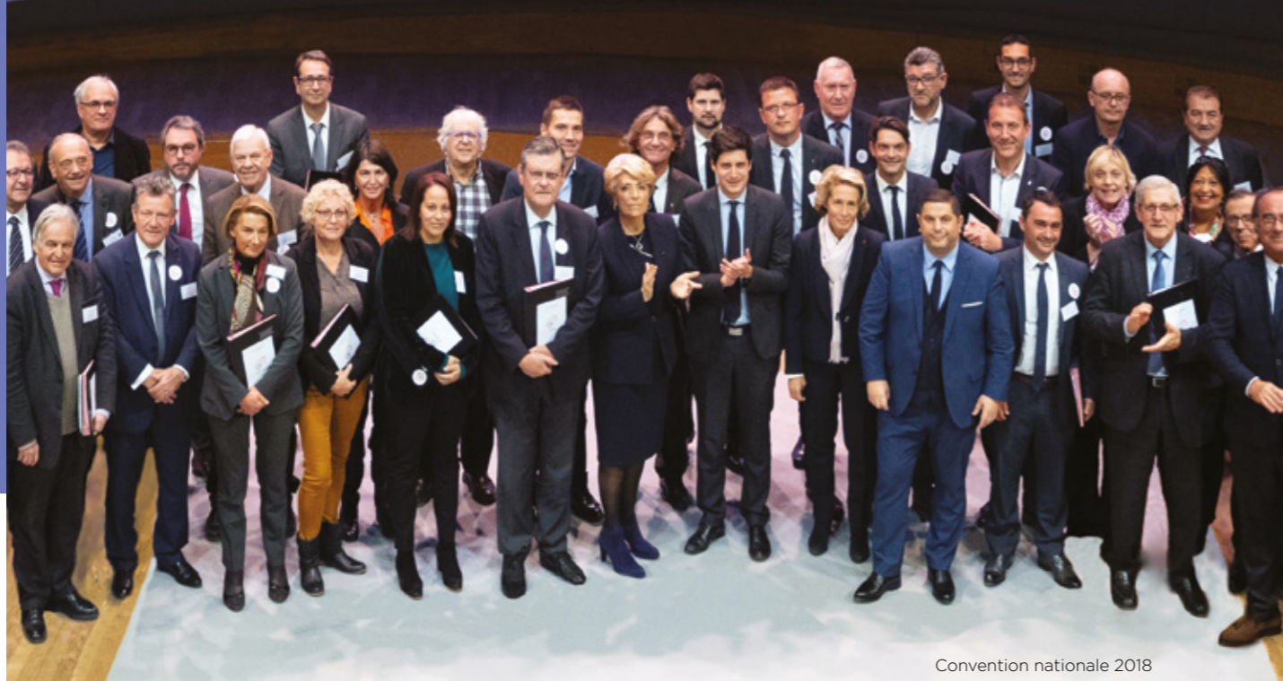
Convention nationale 2018